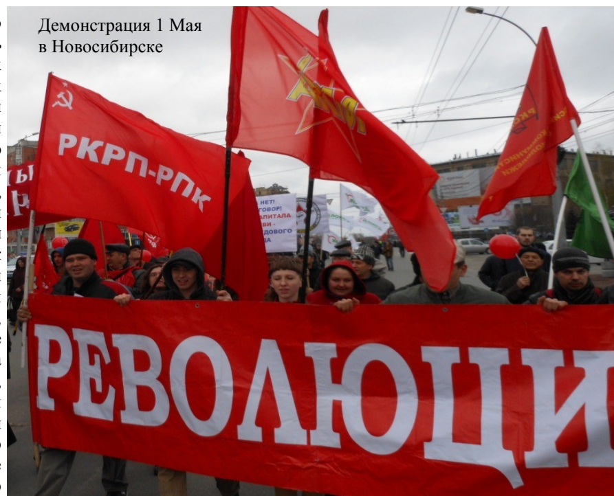
Демонстрация 1 Мая в Новосибирске

устраивает ельцинский триколор. Не устраивает их только Путин и его окружение во главе буржуазного государства, они сами хотят занять это место. Поэтому они и занимаются демагогией насчет бесцветного «гражданского движения». Таким образом, позиция части левых сомкнулась здесь с позицией либералов, и... оказалась на руку Путину. Ведь если бы с самого начала митинги за честные выборы были покрыты красными флагами, то их было бы намного трудней представить «оранжистскими».