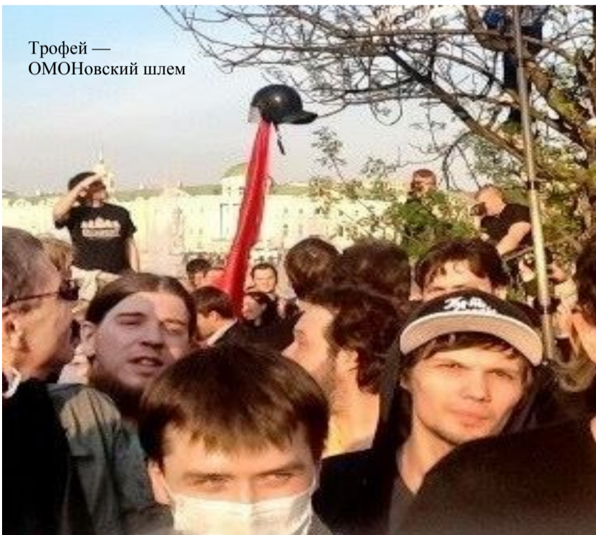
Трофей — ОМОНовский шлем

Побоище 6 мая стало первым лучом восходящего красного солнца, которое пробудит постсоветский пролетариат от продолжительной спячки.