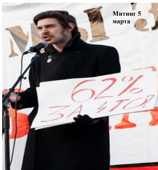
Митинг 5 марта

Если развивать эту тему дальше, то и победа КПрФ и Зюганова не была бы, конечно, свержением